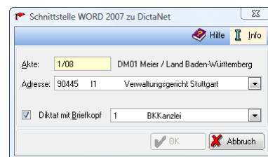
„RA-DIKTAT“ Schnittstelle zu der RA-MICRO Kanzleisoftware

„RA-DIKTAT“ ist unabhängig davon einsetzbar, ob und welche Kanzleisoftware Sie verwenden. Wird „RA-DIKTAT“ zusammen mit der RA-MICRO Kanzleisoftware eingesetzt, stehen Schnittstellen wie die zur RA-MICRO Aktenverwaltung zur Verfügung, wodurch weitere Rationalisierungseffekte eintreten.